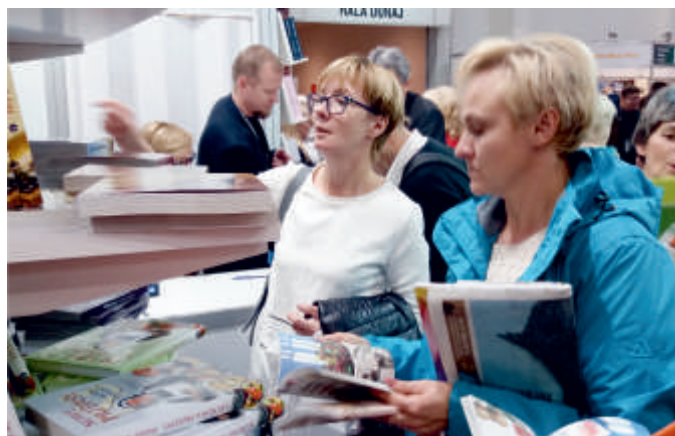
Międzynarodowe Targi Książki, Kraków 2017 r.