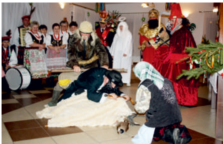
Widowisko obrzędowe „Kolędniczy z Poniedziału” w wykonaniu Zespołu Pieśni i Tańca Wiśliczanie, 14 grudzień 2017 r.