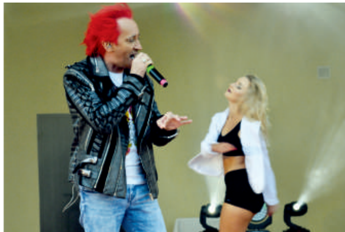
MICHAŁ WIŚNIEWSKI - koncert Święto Ekologii, Dożynki Powiatu Staszowskiego i Gminy Bogoria, sierpień 2018 r.