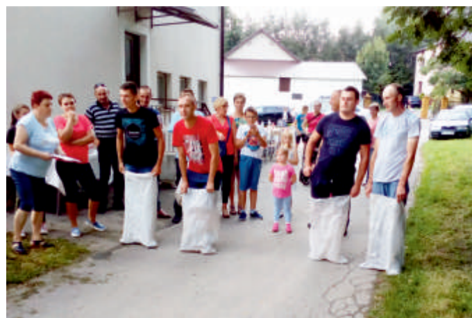
Zawody sportowe przy Świątlicy w Domaradzicach - Lokomotywa do Aktywności Fizycznej, 2018 r.

„Festyn Ekologiczny” - projekt realizowany w 2018 r. przez Stowarzyszenie „Nasza Gmina Bogoria” w ramach Projektu Grantowego Lokalnej Grupy Działania Białe Ługi „Ekologia i ekoturystyka-promocja i wsparcie działań pozytywnie wpływających na ochronę środowiska oraz przeciwdziałających zmianom klimatu”.