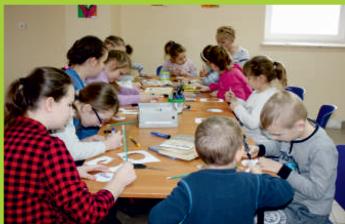
Zajęcia, Świetlica Wiejska w Jurkowicach, ferie, 2018 r.

Wydawca: Gmina Bogoria 28-210 Bogoria, ul. Opatowska 13, tel. 15 867 42 81, fax 15 867 42 81 www.bogoria.pl, urzadz@bogoria.pl