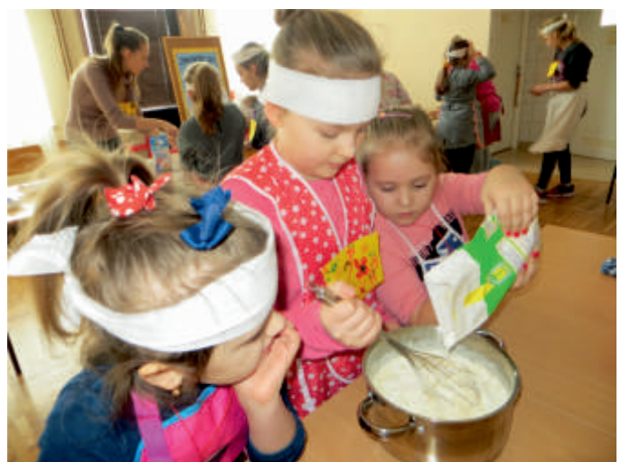
„Kulinarne przygody smakolyków”, Przyborowice. Aktywnie-Kreatywnie, 2018 r.

z gminy Bogoria oraz Fundacja Aktywizacja i Rozwoju Młodzieży FARMA. Współpraca ta dotyczy wielu obszarów i sprawia, że mieszkańcy gminy mogą wiele skorzystać, ponieważ skierowana jest do różnych grup społecznych. Najubożsi mogą otrzymać artykuły żywnościowe, wszyscy