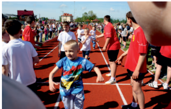
Bieg po zdrowie o puchar wójta gminy Bogoria, 2015 r.