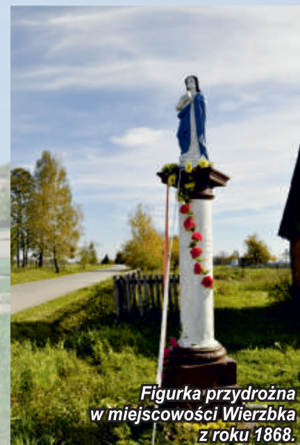
Figurka przydrożna w miejscowości Wierzbka z roku 1868.

postawiono pomnik w Bogorii i w miejscu jego głównej kwatery koło Grzybowa na tzw. „Wygwizdowie”. W Małej Wsi upamiętniono ppłk Antoniego Wiktorowskiego „Kruka”, żołnierza AK – stawiając mu pamiątkowy obelisk a na ścianie kościoła w Bogorii umieszczono tablicę pamiątkową.