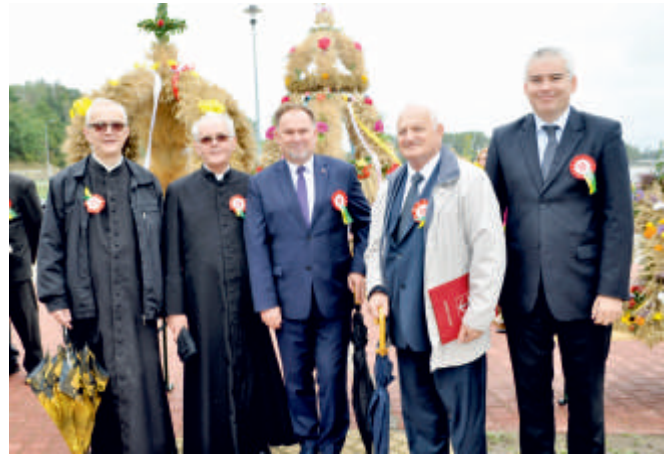
Święto Ekologii, dożynki gminy Bogoria, 2017 r.