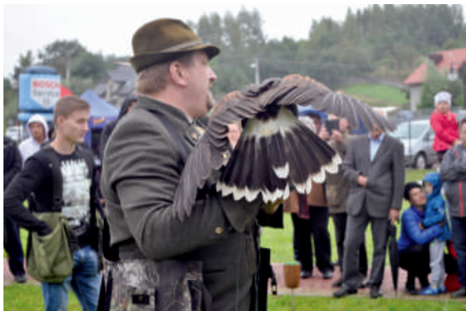
Pokaz sokolniczy podczas Festynu Ekologicznego 2018 r.