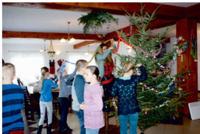
Warsztaty przedświąteczne rękodzieła, Wysoki Średnie, 2015 r.