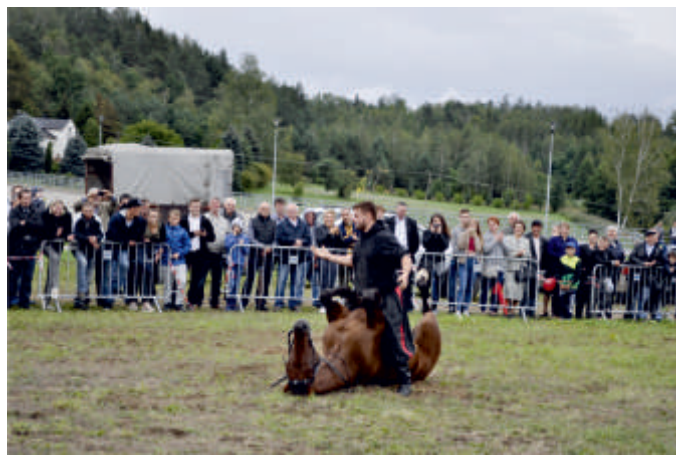
Pokaz kaskaderski - Gala Koni Hodowlanych, 2017 r.