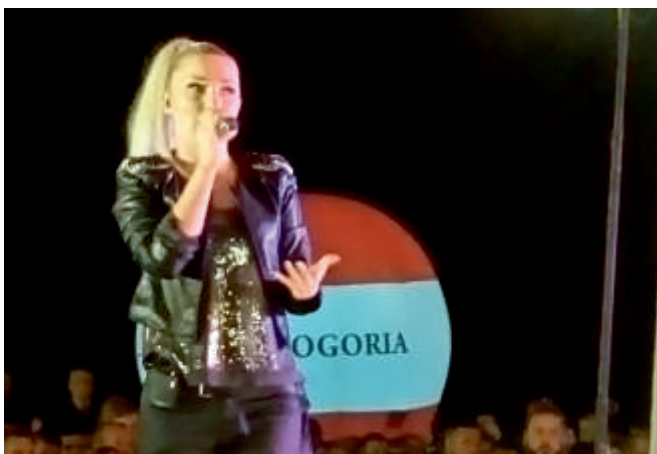
CLEO, wrzesień 2016 r. Święto Ekologii, Dożynki Gminy Bogoria.