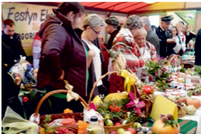
Konkurs „Moja spiżarnia smaków”, Festyn Ekologiczny, 2018 r.