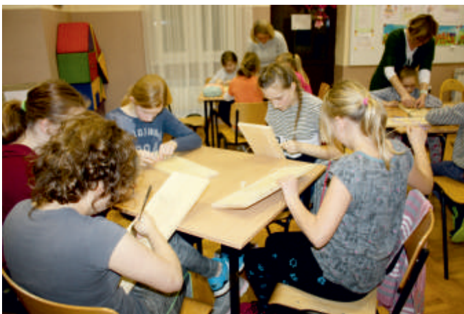
Zajęcia plastyczno-tkackie, Przyborowice. Aktywnie - Kreatywnie, 2018 r.