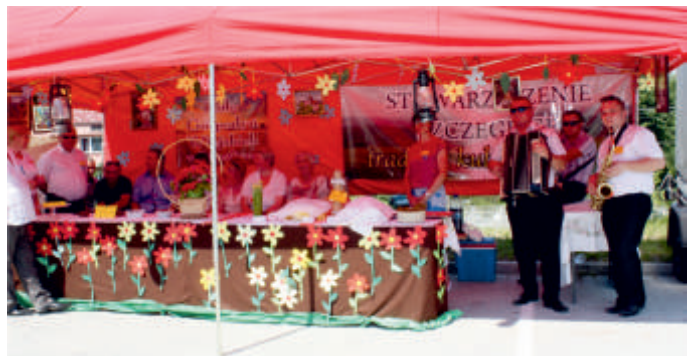
Stoisko Stowarzyszenia Szczeglice - Tradycja, Kultura, Rozwój podczas Święta Pieroga w 2015 r.

„Gala koni hodowlanych różnych ras” - projekt realizowany w 2017 r. przez Stowarzyszenie „Buczyna” w ramach Projektu Grantowego „Cykl imprez i wydarzeń kulturalnych wykorzystujących zasoby obszaru LGD Białe Ługi”.