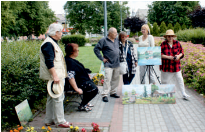
Plener malarsko-rzeźbiarski, „Pędzlem po gminie Bogoria”, 2015 r.