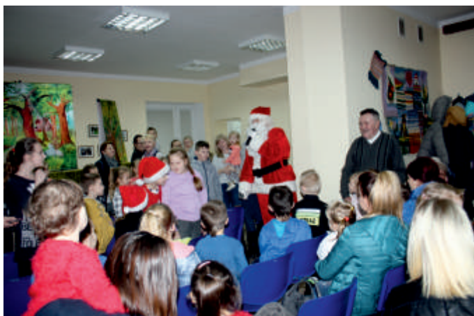
Spotkanie z Mikołajem, Jurkowice, Festiwal Aktywności, 2017 r.