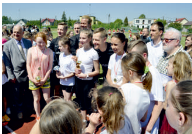
Wręczenie pucharów „Biegu po zdrowie o puchar wójta gminy Bogoria”, 21 maj 2016 r.