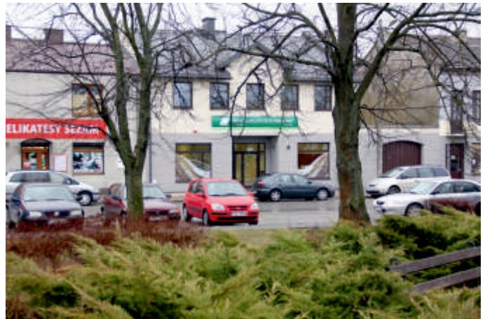
Rynek w Bogorii