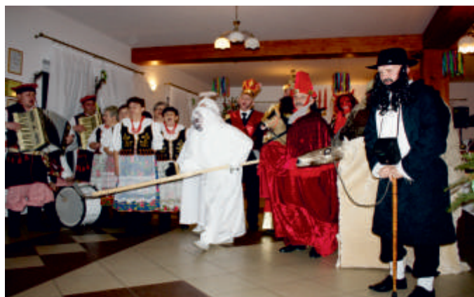
Wysoki Średnie 14 grudnia 2017 r. - widowisko obrzędowe.