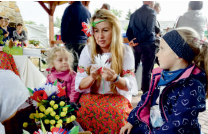
Święto Pieroga w Wysokach Średnich - kącik artystyczny dla dzieci, 2018 r.