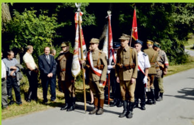
Uroczystości „Ocalmy od zapomnienia”, Cebzer 2017 r.