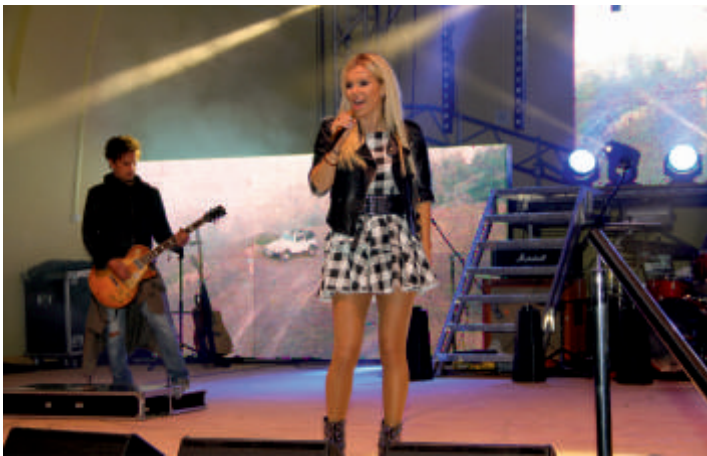
DODA - koncert wrzesień, 2015 r., Święto Ekologii, Dożynki Gminy Bogoria.