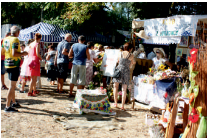
Stoisko promocyjne Grupy Pasjonatów w Jurkowicach. Pcjonaci w Działaniu, 2015 r.