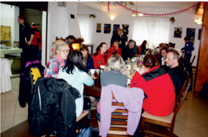
Uczestnicy XII Rajdu Wiosennego Politechniki Świętokrzyskiej - przystanek w Świetlicy Wiejskiej w Wysokach Średnich, 09 kwiecień 2016.