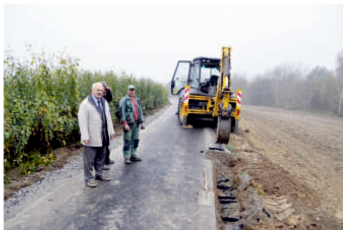
Budowa odcinków dróg gminnych.