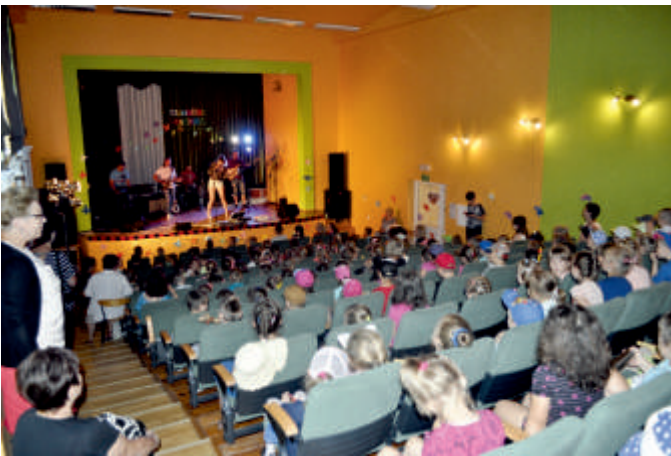
Sala widowiskowa w Domu Kultury w Bogorii