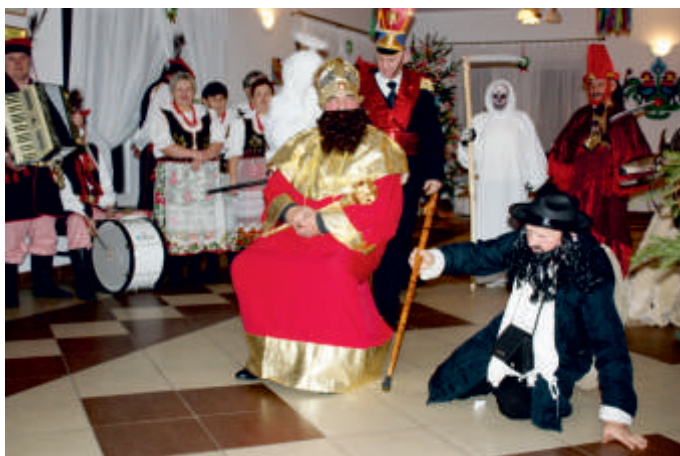
Kolędniczy z Ponidzia, Wysoki Średnie, 2017 r.