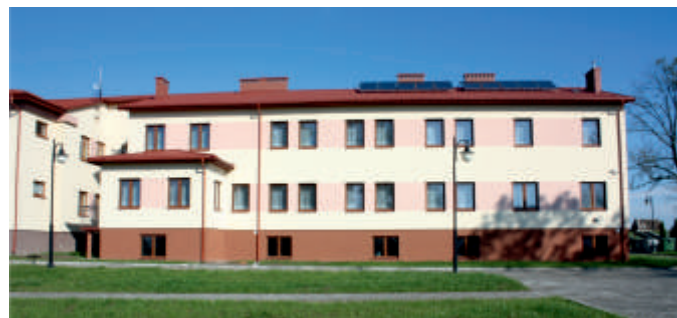
DPS w Pęcławicach, nowe skrzydło.