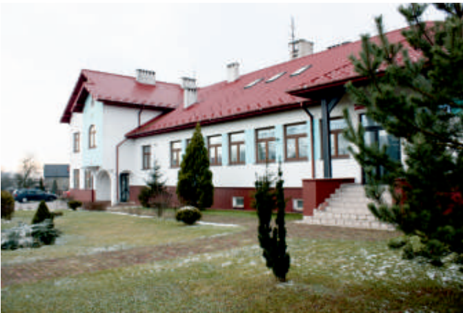
Urząd Gminy w Bogorii