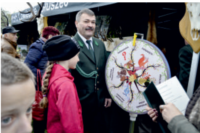
Kolo Łowieckie Głuszc. Promocja działalności, 2017 r.

Gmina Bogoria współpracuje z organizacjami pozarządowymi oraz podmiotami, które prowadzą działalność pożytku publicznego. Są to: Stowarzyszenie „Świętokrzyski Bank Żywności” Organizacja Pożytku Publicznego, Stowarzyszenie „Nasza Gmina Bogoria”, Stowarzyszenie zwykłe „Zorza Junior”, Stowarzyszenie „Buczyna”, Stowarzyszenie „Damy Radę”, Stowarzyszenie „Szczeglice – Tradycja, Kultura, Rozwój”, Lokalna Organizacja Turystyczna „CZYM CHATA BOGATA”, Jednostki Ochotniczych Straży Pożarnych