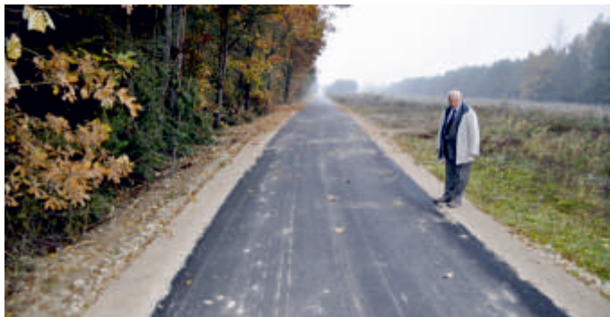
Droga 0355W Kolonia Bogoria - Strużki