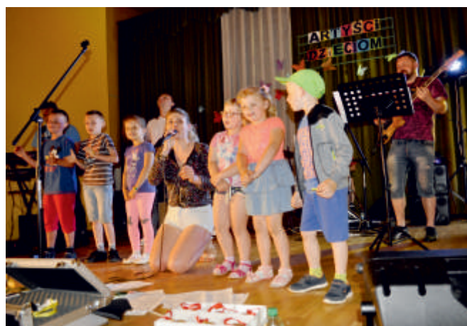
Wspólny występ - koncert „Artyści-dzieciom” 29 maj 2018 r.