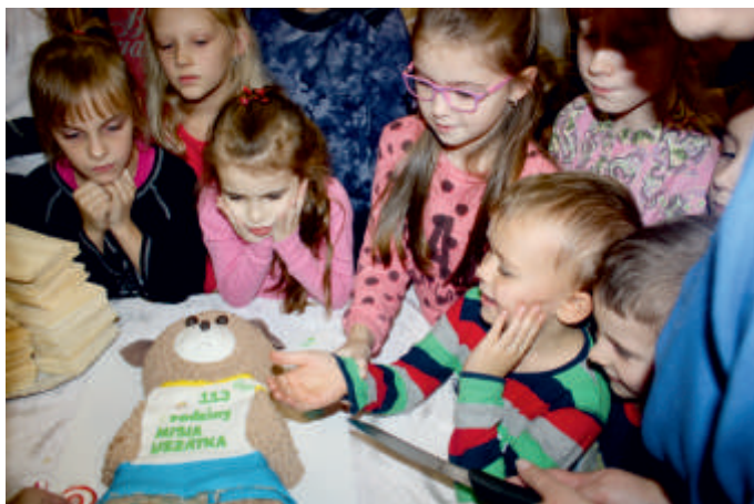
Urodziny Misia Uszatka, WDK w Przyborowicach, 2015 r.