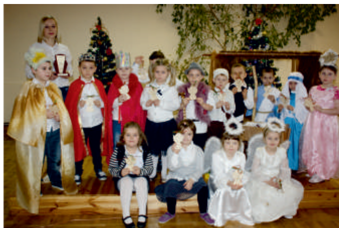
Gwiazdeczka, 2016 r.