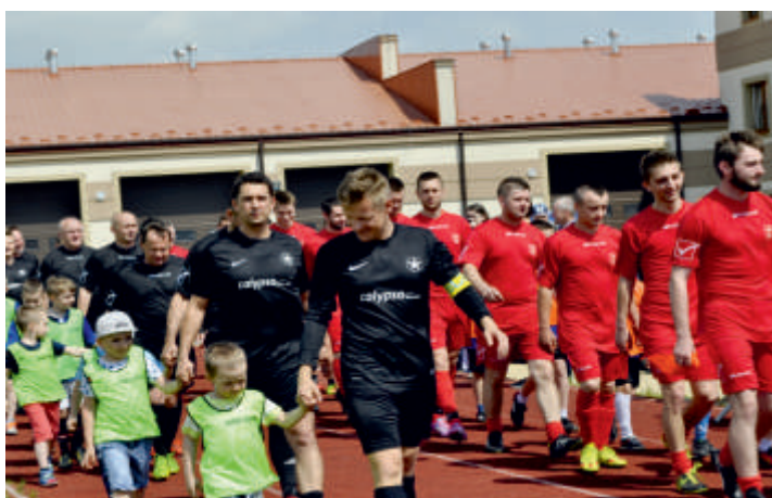
Wychodzimy na mecz „Gwiazdy telewizji kontra Bogoria i Reszta Świata”, 2017 rok.