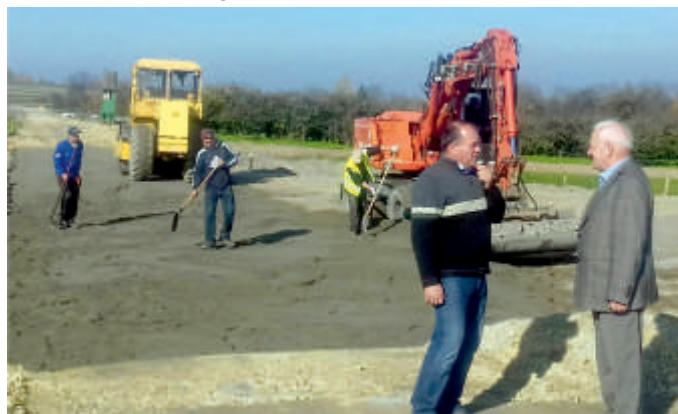
Droga 312014T Wysoki Średnie