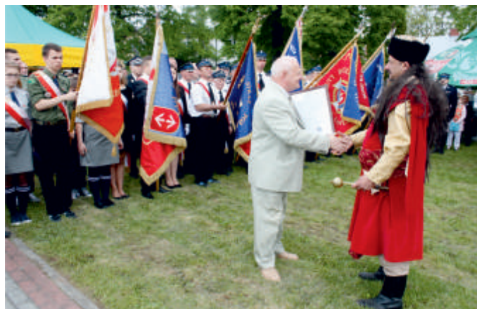
Jubileusz nadania 400-lecia praw miejskich Bogorii, 22-05-2016.