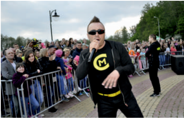
CZADOMAN, Majówka nad zalewem Buczyzna, 2017 r.