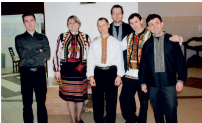
Dzień Kobiet w świetlicy w Wysokach Średnich - koncert ukraińskiego zespołu NEBOKRAY, 2015 r.