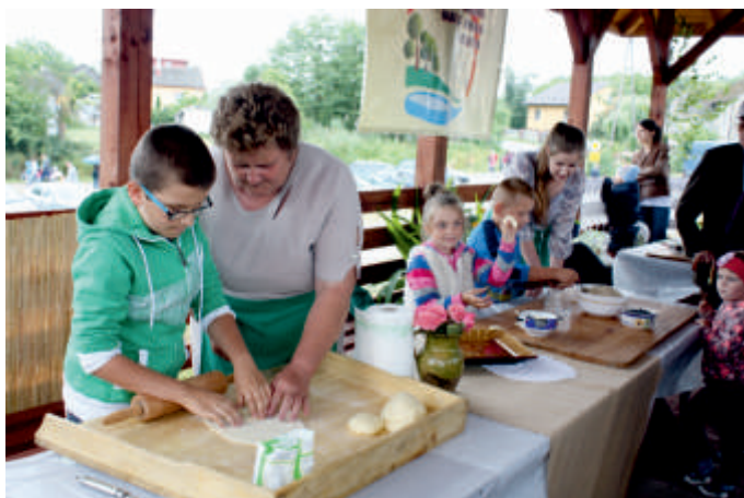
Warsztaty lepienia pierogów, Wysoki Średnie 2016 r.