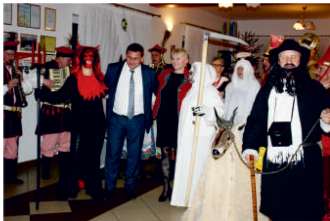
Kolędniczy z Ponidzia w Wysokach Średnich, 2017 r.