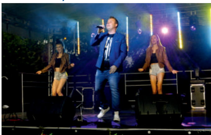
SUMMER NIGHT, Święto Pieroga 2018 r.