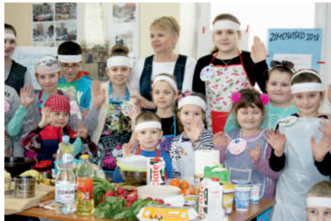
Warsztaty „Kulinarne przygody smakołyków”, Jurkowice. Aktywnie - Kreatywnie, 2018 r.