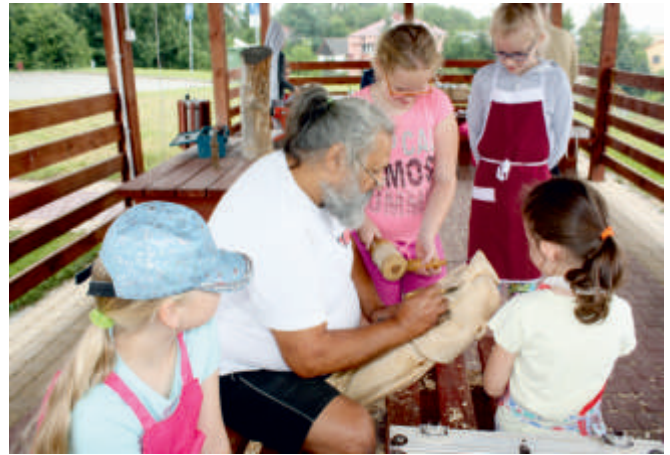
Plener malarsko-rzeźbiarski - „Dłutem i pędzlem - Nasze Świętokrzyskie”, Wysoki Srednie 2018 r.