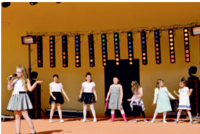
Występy dzieci z sekcji wokalnejs Domu Kultury w Bogorii - Majówka 2017 r.