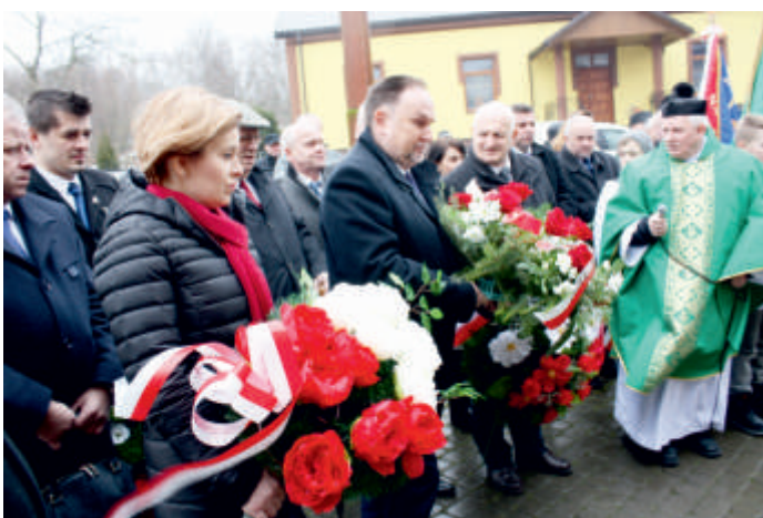
Szczeglice, uroczystości patriotyczne - składanie kwiatów pod tablicą upamiętniającą wydarzenia okresu Powstania Styczniowego, 2018 r.