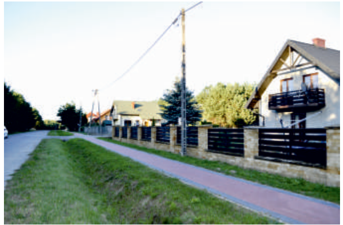
Osiedle Ujazd w Bogorii