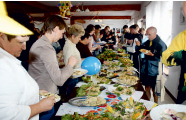
Święto Pieroga w Wysokach Średnich, 2016 r.