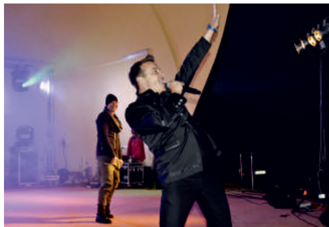
WEEKEND - koncert 2017 r.