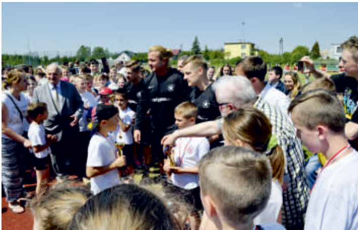
Przed meczem „Gwiazdy Telewizji kontra Bgoria i Reszta Świata”, wręczanie pucharów uczestnikom biegu, 2016 r.