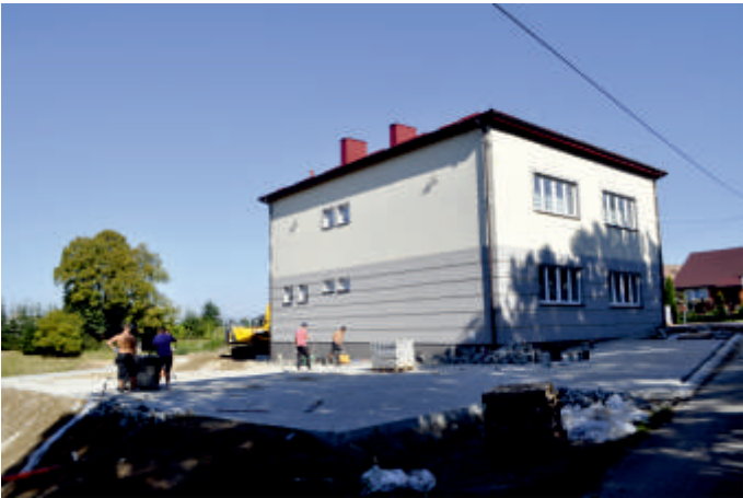
Budowa placu zabaw obok Świetlicy Wiejskiej w Grzybowie