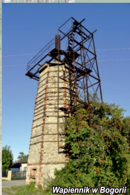
Wapiennik w Bogorii