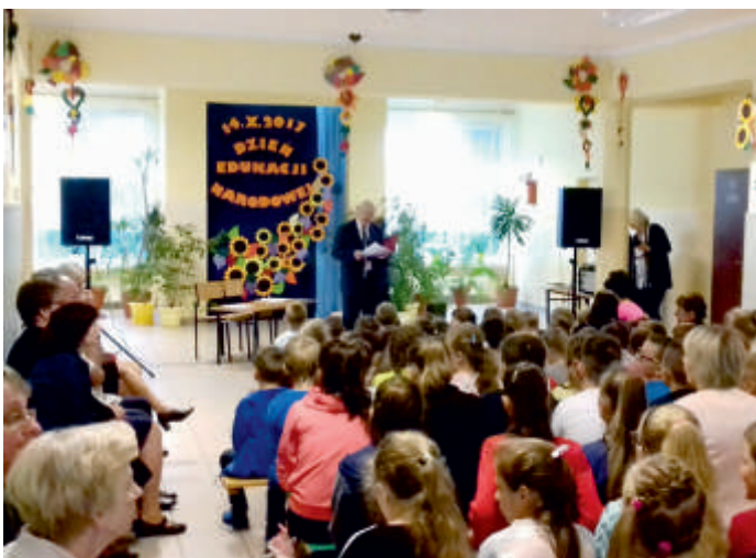
Szkoła Podstawowa w Jurkowicach, Dzień Edukacji Narodowej, 2017 r.