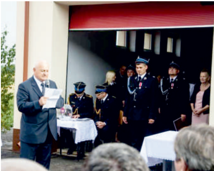
Uroczyste obchody 100-lecia OSP w Pęcławicach Górnych