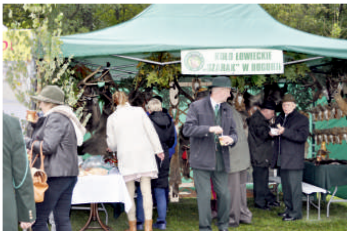
Koło Łowieckie Szarak. Promocja działalności, 2017 r.