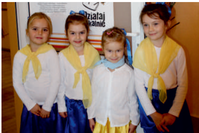
Konkurs Piosenki Religijnej, 2016 r.