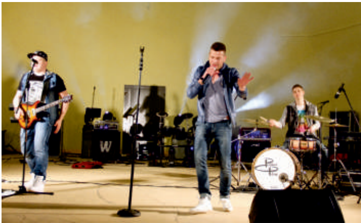
POWER PLAY - Majówka 2015 r.