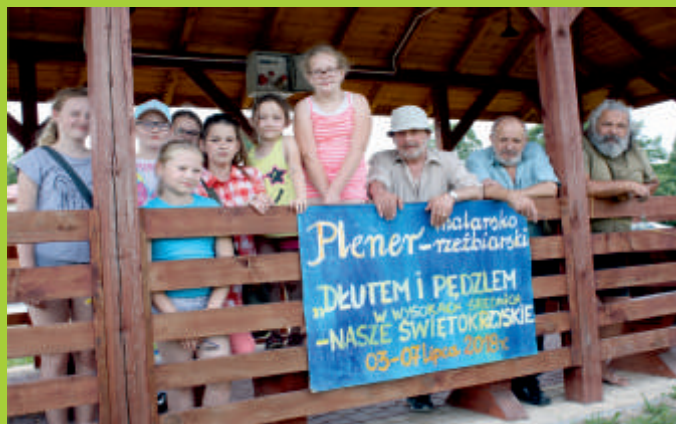
Wysoki Średnie, plener, 2018 r.