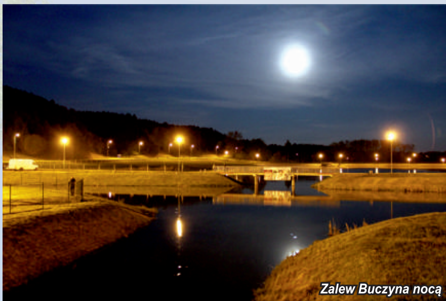
Zalew Buczyzna nocą

Zróżnicowanie gleb w gminie sprawia, że szata roślinna w tej okolicy jest również bardzo różnorodna. Wschodnią część gminy stanowią urodzajne lessy i jest ona okolicą typowo rolniczą, zaś zachodnie połacie pokryte są lasem. W przeszłości na żyznych glebach istniały majątki szlacheckie, których ślady w postaci założeń parkowo – dworskich spotykamy m.in. w miejscowościach: Ceber, Gorzków, Jurkowice, Kiełczyzna, Szczeglice. Występują tu również drzewa chronione, które są pomnikami przyrody. I tak w Gorzkowie to jesion,