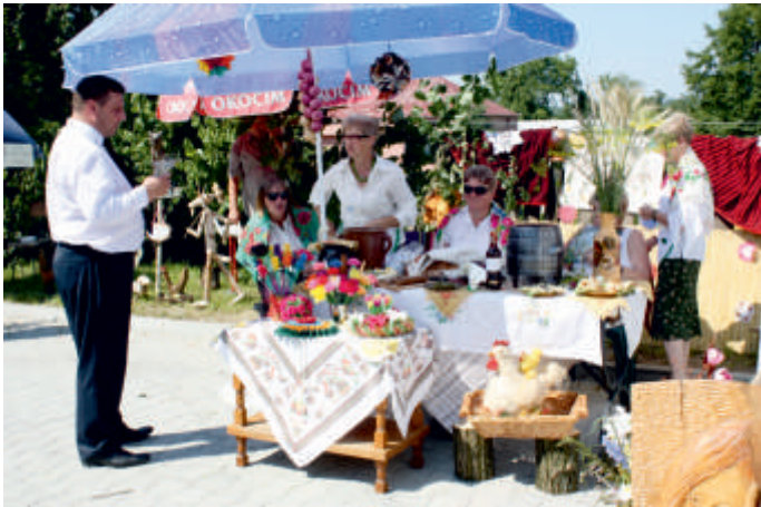
Stoisko Koła Gospodyń z Miłoszowic, Święto Pieroga 2015 r.