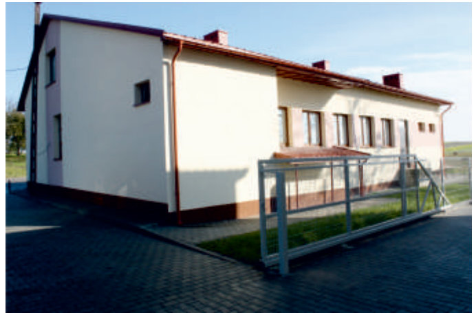
Budynek OSP w Pęcławicach Górnych po kapitalnym remoncie