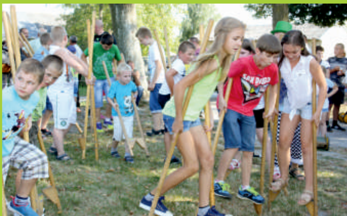
Święto Dolomitu 2015 r. - atrakcje dla dzieci.