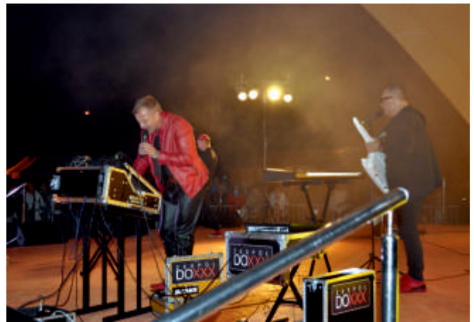
DOXXX - wrzesień, 2017, Święto Ekologii, Dożynki Gminy Bogoria.