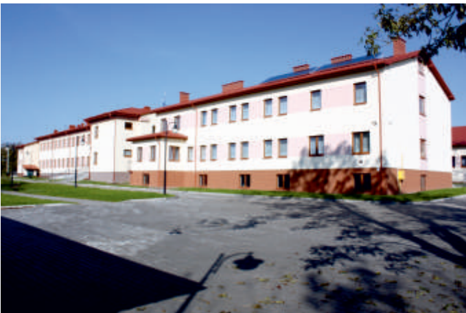
Dobudowane skrzydło Domu Pomocy Społecznej w Pęcławicach Górnych