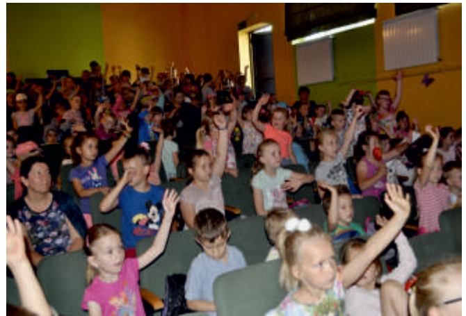
Dzień Dziecka - koncert „Artyści-dzieciom”, 2018.