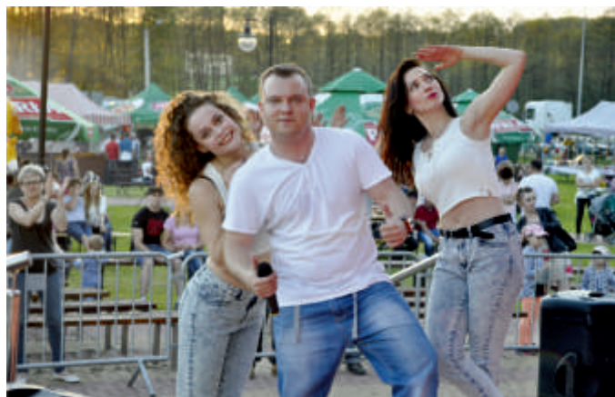
SUMMER NIGHT, Majówka - zalew Buczyzna, 2017 r.