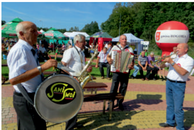
Kapela SAMI SWOI, dożynki gminy Bogoria 2015 r.