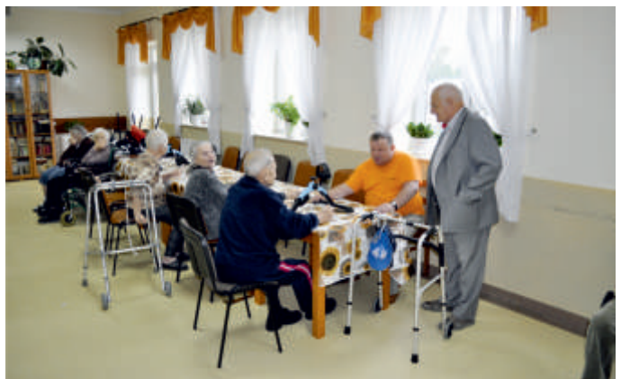
Wójt w rozmowie z pensjonariuszami w DPS w Pęcławicach Górnych