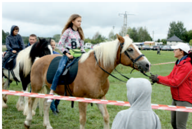
Mini szkółka jeździecka dla dzieci, Gala Koni, 2017 r.