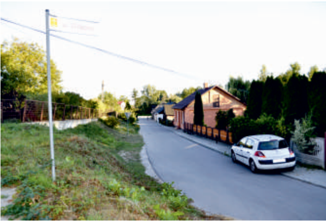
Ulica Wilsona w Bogorii