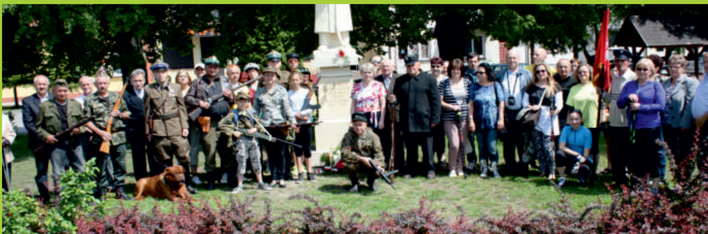
Rajd - Szlakiem Marszałka Józefa Piłsudskiego po Ziemi Bgoryjskiej, 31 maj 2015 r.