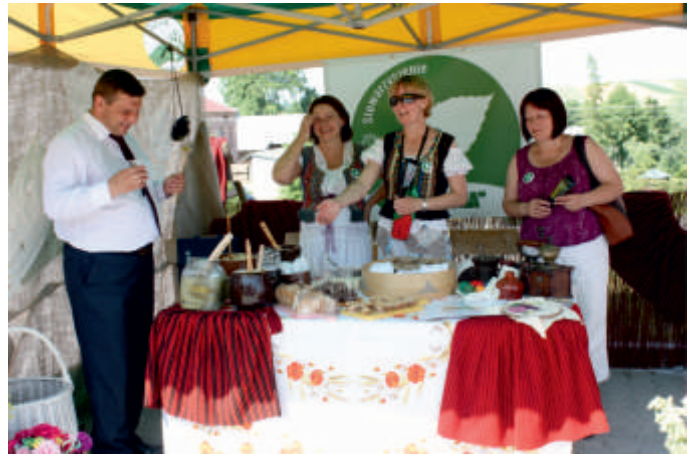
Stoisko stowarzyszenia „Buczyna” podczas Święta Pieroga w 2015 r.