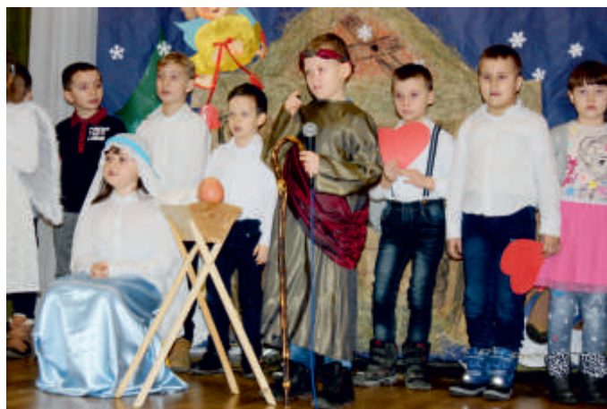
Gwiazdeczka, 2018 r.