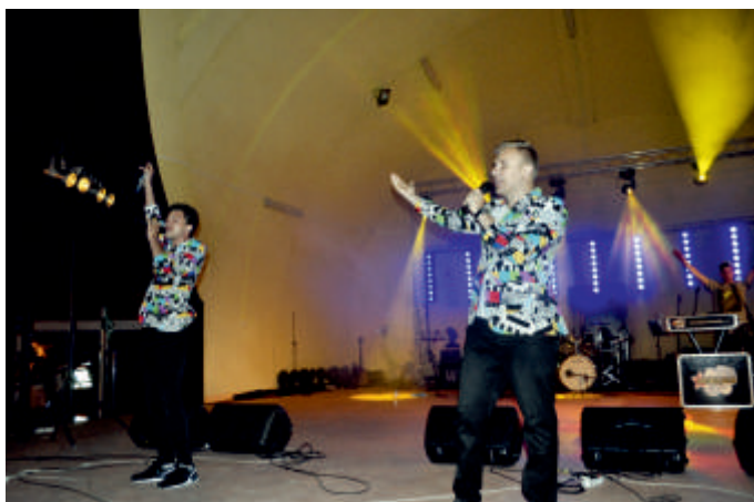
MENLAOS - Majówka nad zalewem Buczyzna, 2018 r.