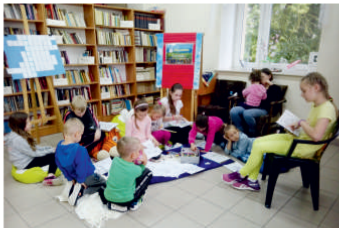
W krainie baśni Andersena, Świetlica w Jurkowicach, 17 maj 2018 r.