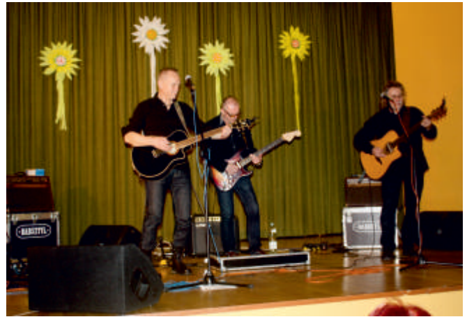
Koncert zespołu Babsztyl, Dzień Kobiet 2016 r.