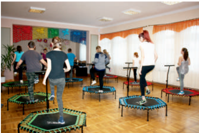
Warsztaty „Zdobywać radość i zdrowie” Przyborowice. Aktywnie-Kreatywnie, 2018 r.