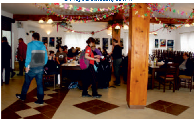
Przystanek rajdu z Politechniki Świętokrzyskiej - Wysoki Średnie 09 kwiecień 2016 r.