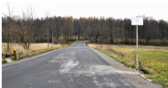
Droga 0093W Jurkowice - Kamieniołom