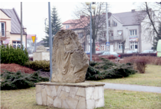
Rynek w Bogorii - rzeźby poplenerowe