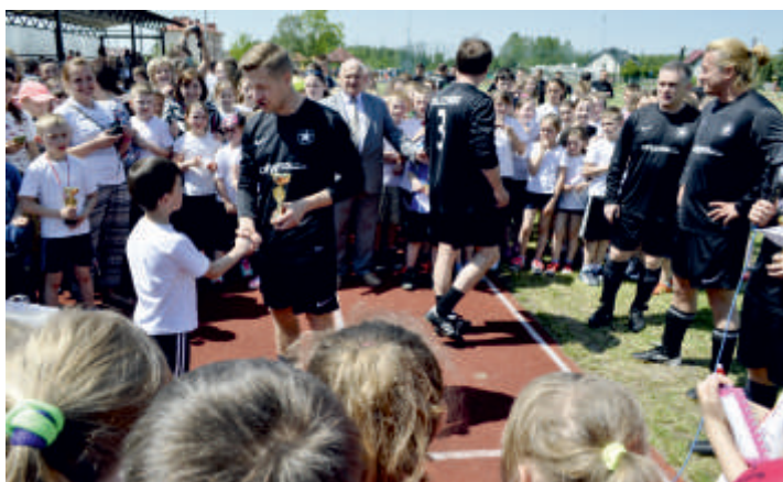
Wręczenie pucharów uczestnikom „Biegu po zdrowie o puchar wójta gminy Bogoria”, 2016 r.