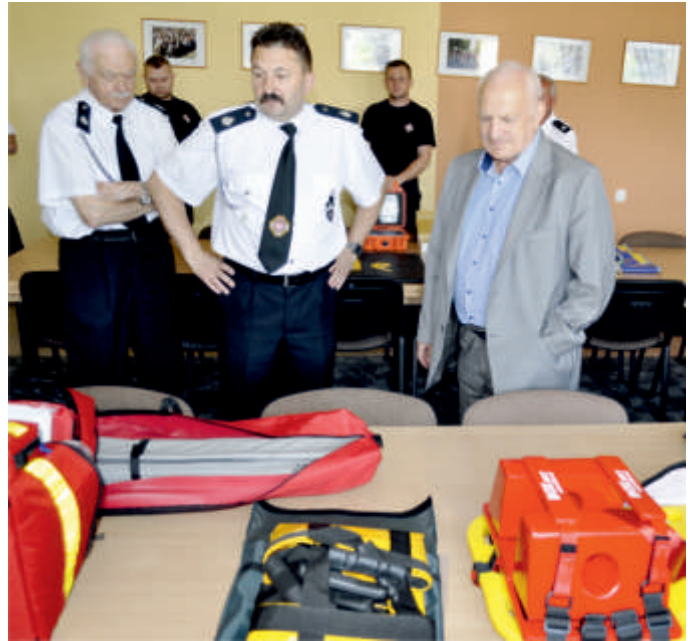
Przekazanie sprzętu dla jednostek OSP gminy Bogoria

OSP w Miłoszowicach otrzymała zestaw ratownictwa medycznego o wartości 5 425 zł . OSP w Pęcławicach Górnych dostała na wyposażenie defibrylator za kwotę 6 912,00 zł .