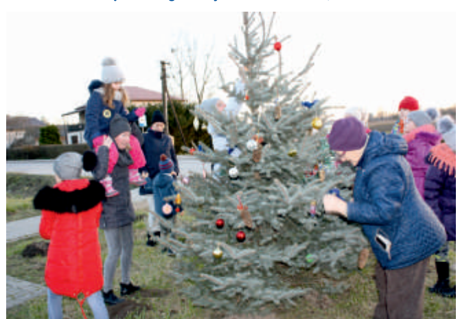
Ubieranie choinki przy Świetlicy Wiejskiej w Jurkowicach 2017 r.