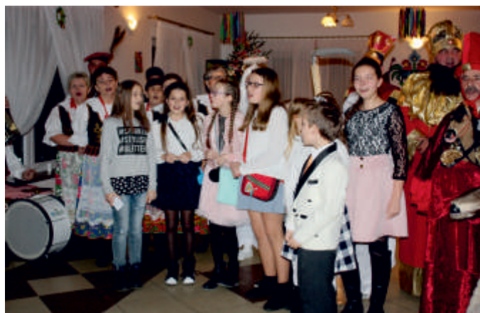
Wysoki Średnie 14 grudnia 2017 r. - widowisko obrzędowe.