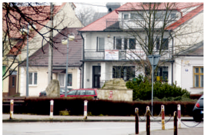
Rynek w Bogorii