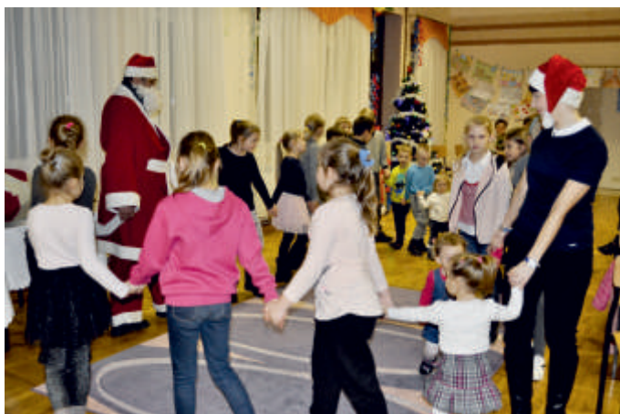
Mikołajki, WDK w Przyborowicach, 2017 r.