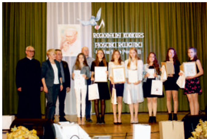
Konkurs Piosenki Religijnej, 2017 r.