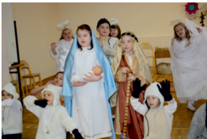
Festiwal Jaselek, 2017 r.