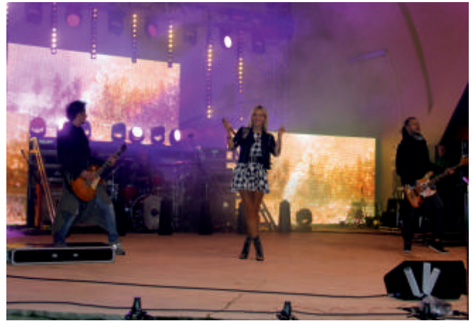
DODA - 2015 r.