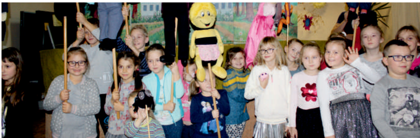
Warsztaty teatralne z przedstawieniem - Teart Lalek Bajka, WDK w Przyborowicach, 2017 r.