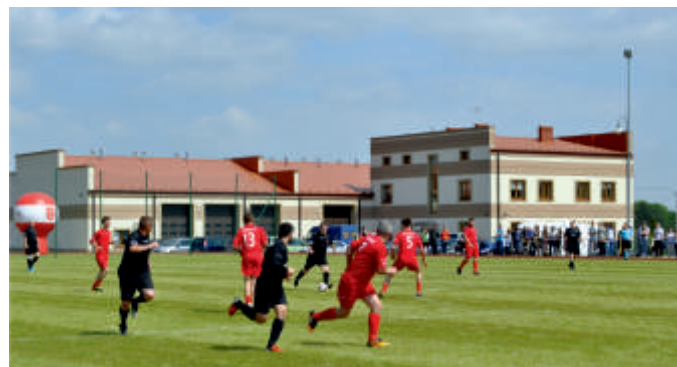
Nowy stadion w Bogorii