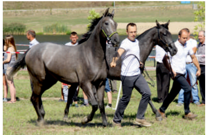
Prezentacja koni hodowlanych różnych ras - 2016 r.