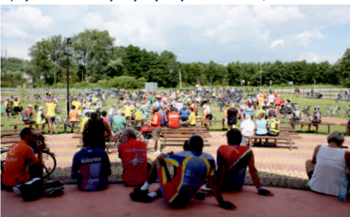
Uczestnicy podczas XIV Europejskiego Tygodnia Turystyki Rowerowej - przystanek nad zalewem Buczyzna w Bogorii, 10 lipiec 2018 r.