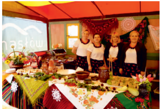
Święto Pieroga w Wysokach Średnich, 2018 r.