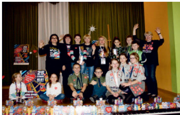
25 Finał WOŚP, 15 stycznia 2017