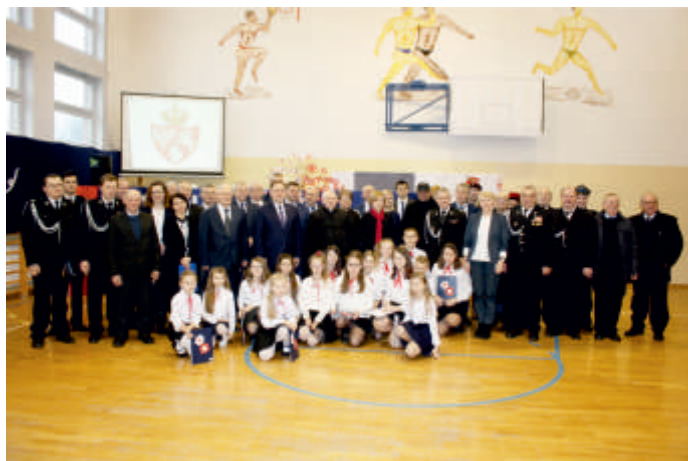
Patriotyczne uroczystości z obchodów rocznicy Powstania Styczniowego w szkole podstawowej w Szczeglicach rok 2018.

W ramach Regionalnego Programu Operacyjnego Województwa Świętokrzyskiego na lata 2014- 2020 , Działanie „Rozwój infrastruktury edukacyjnej i szkoleniowej” prowadzona jest rozbudowa i modernizacja Zespołu Placówek Oświatowych w Jurkowicach finansowana w wysokości 2 814 901,36 zł ze środków Europejskiego Funduszu Rozwoju Regionalnego oraz 938 300,45 zł z budżetu Gminy . Celem projektu jest rozbudowa szkoły w Jurkowicach o blok żywieniowy pod potrzeby szkoły i przedszkola oraz budowa kompleksu sportowego z wielofunkcyjnym boiskiem do piłki nożnej, piłki ręcznej, siatkówki i koszykówki a także termomodernizacja obiektu. Termin realizacji: 30.11.2016 – 30.12. 2018.