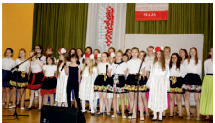
Akademia z okazji 3 Maja przygotowana przez szkołę podstawową w Bogorii, 2018 r.