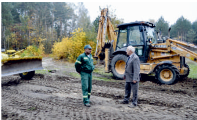
Droga 0200W Niedźwiedź Kinia