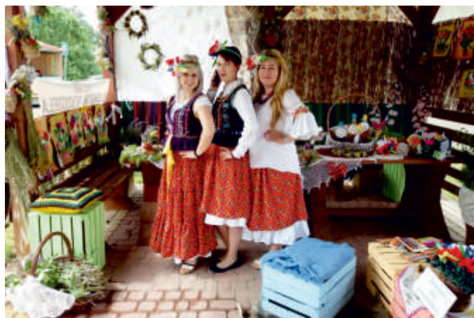
Stoisko Grupy Pasjonatów z Gminy Bogoria, Święto Pieroga 2018 r.