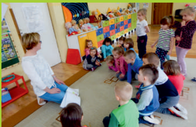
Zajęcia biblioteczne w przedszkolu w Bogorii, 2018 r.