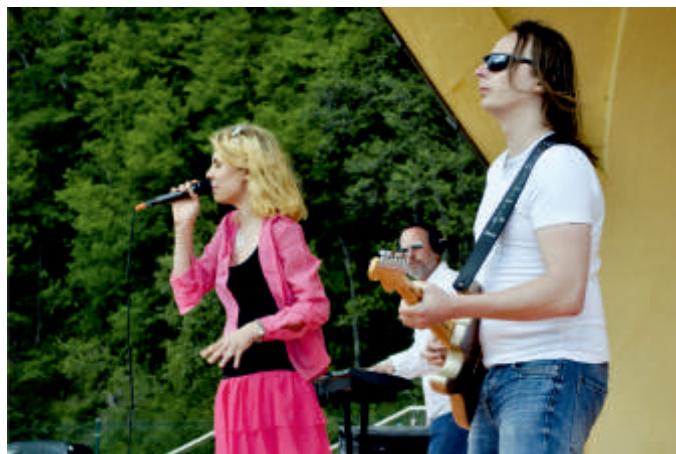
ROLLER COVER - Majówka 2017 r.