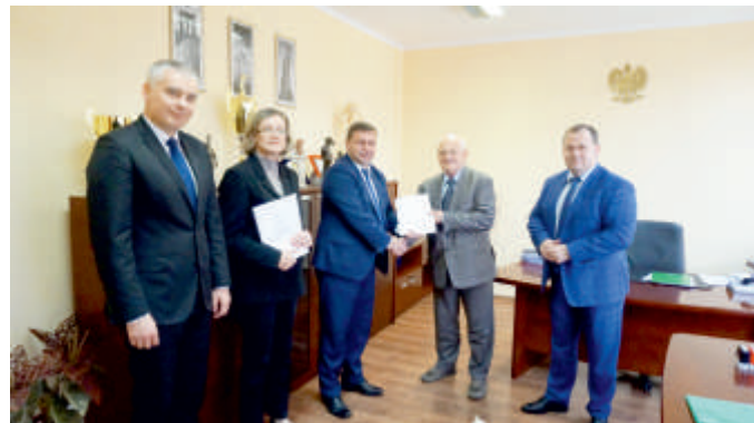
Podpisanie umowy w sprawie przygotowania i wspólnej realizacji projektu „Rewitalizacja centrum miejscowości Bogoria wraz z przyległymi ulicami”.

28 lat to kawał czasu. Przez ten okres nasza gmina zmieniła się nie do poznania. Wszystkie miejscowości w gminie wypiękniały. Powstały nowe budynki użyteczności publicznej, drogi, ulice, chodniki, parkingi, boiska sportowe, place zabaw dla dzieci. Odnowiliśmy Centra wszystkich miejscowości w gminie. Sieć wodociągowa obejmuje całą gminę, kanalizacją objęta jest 60% gminy, gazyfikacja jest daleko zaawansowana. Drogi gminne i powiatowe mają bardzo dobry stan nawierzchni. Obiekty oświatowe są nowo wybudowane, bądź wyremontowane, wyposażone w hale sportowe, boiska oraz bardzo dobrze urządzone pracownie dydaktyczne. Prężnie działa Gminny Ośrodek Kultury ze świetlicami wiejskimi i świetlicami – remizami, gdzie w ostatnich latach rozwija się aktywność mieszkańców