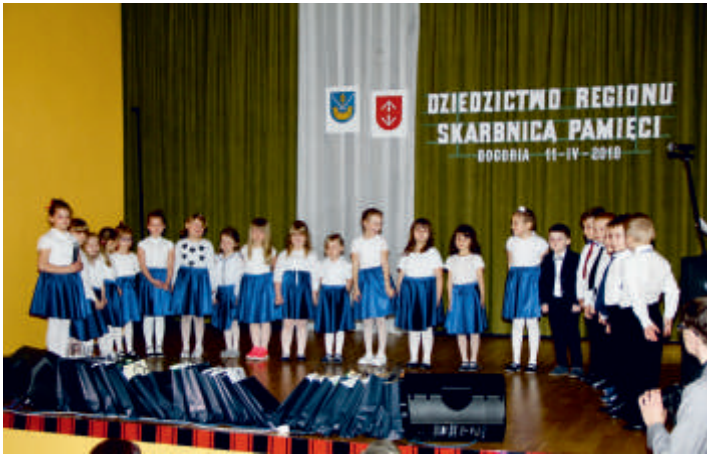
Konferencja „Dziedzictwo Regionu Skarbnicą Pamięci”. Występy dzieci z przedszkola w Bogorii. 11 kwiecień 2018 r.