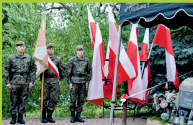
Uroczystości patriotyczne „Ocalić od zapomnienia”, Cebzer 2018 r.