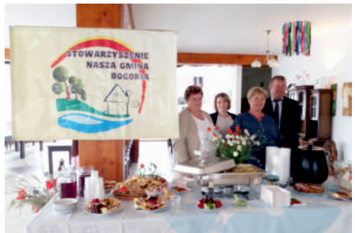
Stoisko Stowarzyszenia „Nasza Gmina Bogoria” podczas Święta Pieroga 2018 r.

wziąć udział w licznych imprezach kulturalnych i sportowych, które przeznaczone są dla wszystkich grup wiekowych a nawet całych rodzin. Działania prowadzone przez te organizacje przyczyniają się do większej aktywności społecznej, bardziej spajają środowisko lokalne, tworzą więzi międzyludzkie oraz budują wzajemne zaufanie. Co roku na tę działalność zaplanowane są stosowne kwoty w budżecie gminy. W latach 2014 – 2015 było to 25 000 zł. Natomiast na lata 2016 – 2018 przeznaczono zostało 15 000 zł. Wszystkie projekty realizowane z tych funduszy każdego roku znajdują się na stronie internetowej Urzędu Gminy Bogoria.