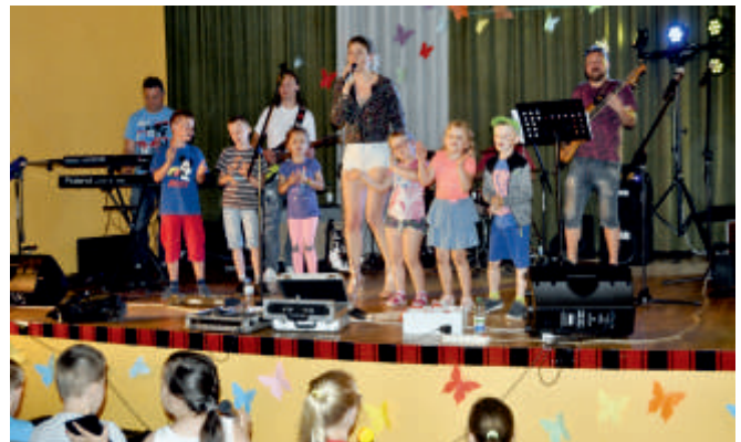
Koncert „Artyści - dzieciom”, 29 maj 2018 r.

W ramach ogólnopolskiej akcji „Drzwi Otwartych Funduszy Europejskich” GOK w Bogorii organizował na obiektach zrealizowanych w gminie Bogoria dzięki funduszom UE imprezy kulturalne i wydarzenia sportowe. Należały do nich organizowane w 2016 i 2017 roku na stadionie gminnego centrum sportu mecze towarzyskie piłki nożnej Gwiazdy Telewizji kontra Bogoria i Reszta Świata i Bieg po zdrowie o puchar wójta gminy Bogoria.