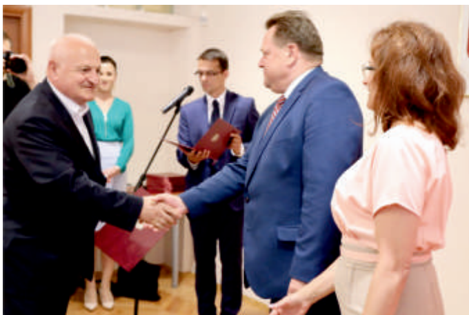
Odebranie z rąk Wiceministra Spraw Wewnętrznych i Administracji Jarosława Zielińskiego promesy na budowę odcinków dróg gminnych

W ramach usuwania skutków klęsk żywiołowych kończone są prace związane z przebudową odcinków dróg gminnych w miejscowościach Pęcławice Górne i Domaradzice. Kwota dotacji przyznanej przez Wojewodę Świętokrzyskiego wyniosła 308 tys. zł.